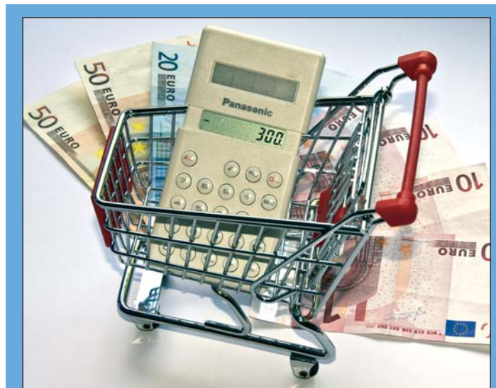
Einer zügellosen Einkaufstour darf die Ausgabenpolitik der Stadt nicht gleichen.

Gerade die vielen ehrenamtlich Tätigen in unserer Stadt sind bei ihrer wertvollen Arbeit auf frei-