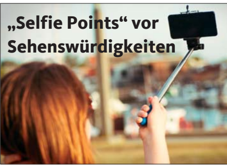
„Selfie Points“ vor Sehenswürdigkeiten